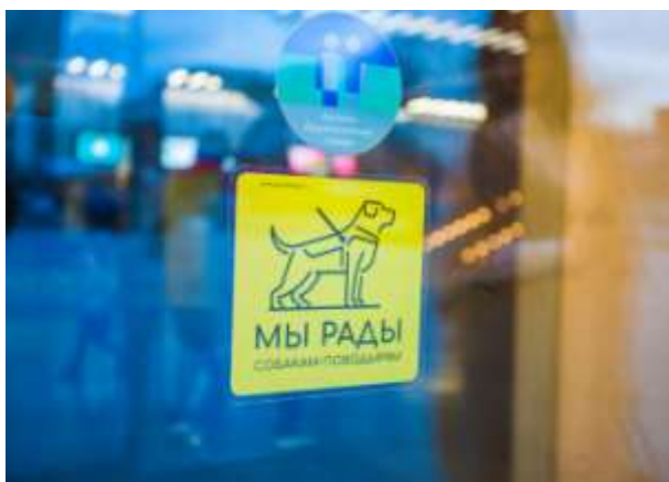
Стикер проекта на дверях музея «Гараж»

24 апреля, в Международный день собаки-поводыря, при поддержке фонда «Искусство, наука и спорт», состоялась презентация проекта «Guide Dog Friendly|Мы рады собакам-поводырям» в музее «Гараж». Проект ««Guide Dog Friendly|Мы рады собакам-поводырям» посвящен распространению информации о беспрепятственном доступе к социальным объектам владельцев собак-поводырей в сопровождении их четвероногих помощников на основании 181 ФЗ «О социальной защите инвалидов».