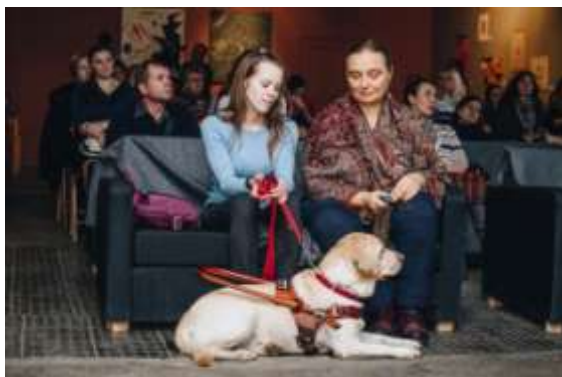
Фотография с презентации в г. Краснодар

В течение 2018 года презентация проекта так же состоялась в Санкт-Петербурге, Екатеринбурге, Нижнем Новгороде, Комсомольске-на-Амуре, Казани, Краснодаре и Уфе. На встречах присутствовали представители организаций культуры городов: музеев, галерей, библиотек, школ искусств.