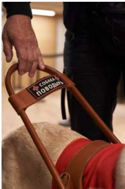
Фотография с презентации в г. Санкт-Петербург

На презентациях мы рассказывали о том, как сделать посещения учреждений приятными и простыми для обеих сторон: владельцев собак-поводырей и принимающей стороны. Так у присутствующих была возможность лично познакомиться с нашими выпускниками – владельцами хвостатых помощников.